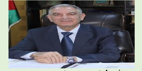
الأستاذ الدكتور عبدالرزاق بني هاني الاقتصاد