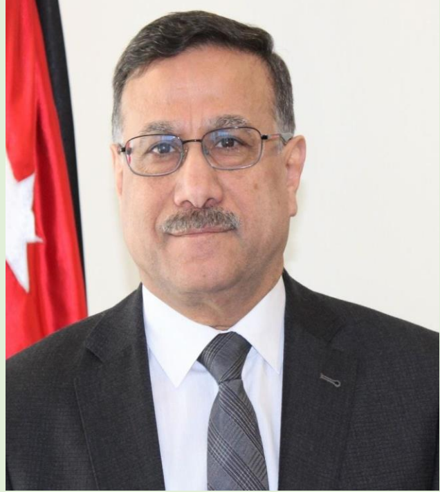
معالي الدكتور عز الدين كناكريه

وفي عام 2012، تم تعيينه مفوضاً في هيئة الأوراق المالية وخلال تلك الفترة حصلت الهيئة على جائزة الملك عبد الله الثاني لتميز الأداء الحكومي والشفافية عن فئة ختم التميز للعام 2012 - 2013، وقد تم إعادة تعيينه أميناً عاماً لوزارة المالية في الفترة 2014 - 2018. وفي شهر أيار من العام 2018، تم تعيينه مديراً عاماً للمؤسسة العامة للضمان الاجتماعي، وقام أيضاً بمهام وصلاحيات منصب رئيس صندوق استثمار أموال الضمان الاجتماعي الذي كان شاغراً في حينه. وفي شهر حزيران من العام 2018 صدرت الإرادة الملكية السامية بتعيينه وزيراً للمالية لغاية شهر تشرين ثاني من العام 2019، وفي شهر كانون أول من عام 2020 تم تعيينه رئيساً لمجلس إدارة شركة الأسواق الحرة الأردنية ومن ثم رئيساً لصندوق استثمار أموال الضمان الاجتماعي في شهر تشرين الثاني 2022 من عام.